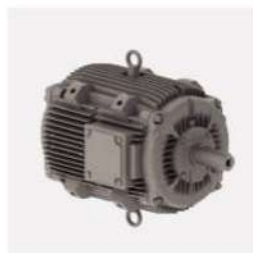
الکتروموتور weg دو سرعته