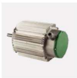
الکترو موتور ۳ سرعته