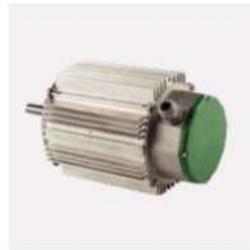
الکترو موتور ۳ سرعته