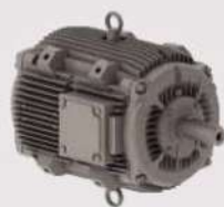
الکتروموتور weg دو سرعته