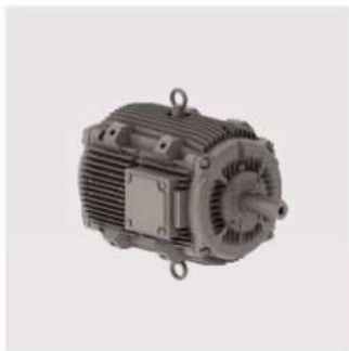
الکتروموتور weg دو سرعت