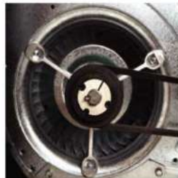
پولی و تسمه