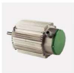
الکترو موتور ۳ سرعته