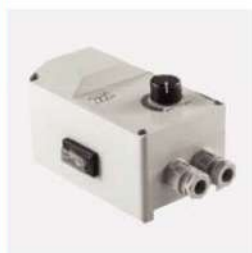
دستگاه تغییر دور