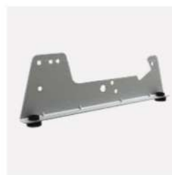
پایه و لرزه گیر