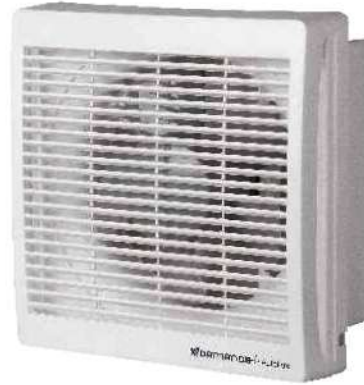
هواکش خانگی با دمپر اتوماتیک

VAL axial extractors are specially designed for ventilation of small and medium rooms, kitchens and office spaces.