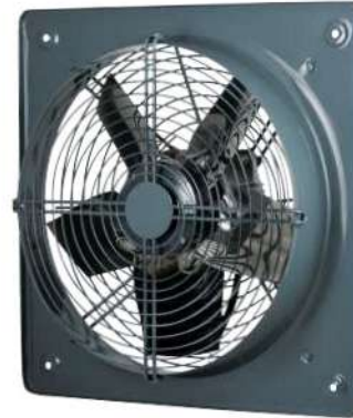
هواکش صنعتی پروانه استیل

Fan application: Supply and extract ventilation installed in various premises, medium humid spaces like pools.